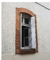
Volet « en tableau »