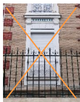
Coffre du volet roulant visible