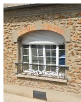
Coffre du volet roulant caché