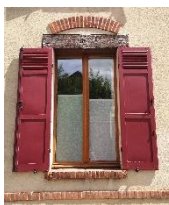
Volets semi-persiennés

La pose de volets roulants est autorisée sur un bâtiment neuf ou récent, et à la stricte condition que les coffres d'enroulement ne soient pas visibles depuis l'extérieur.