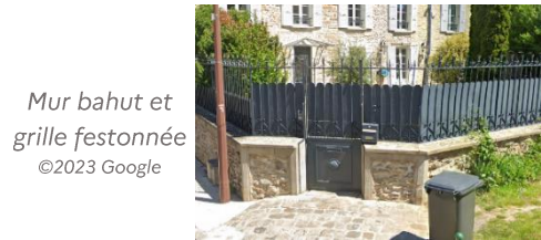
Mur bahut et grille festonnée