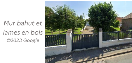
Mur bahut et lames en bois

Les piers doivent être assez larges (une cinquantaine de centimètres) et inspirés des modèles anciens existants dans la commune : en pierre jointoyée, en brique traditionnelle ou maçonnerie pleine et enduite, sans effet de joint creux ou ni éléments préfabriqués. L'allège des portails dotés d'une grille peut être pleine en partie basse.