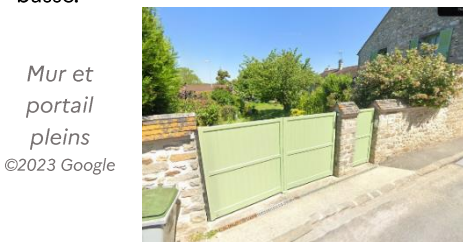
Mur et portail pleins

Les nouveaux portails et portillons sont de forme rectangulaire simple et leur largeur maximum est de 3,50m. Ils doivent reprenre la typologie de la clôture qu'ils complètent : ils sont ajourés pour une clôture grillagée, ou pleins pour un mur en pierre ou un mur bahut surmonté de lames en bois. L'allège des portails dotés d'une grille peut être pleine en partie basse.