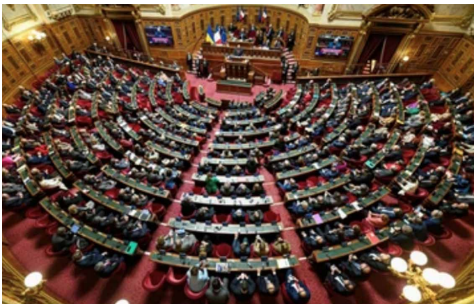
L'hémicycle, là où les sénateurs sont réunis.