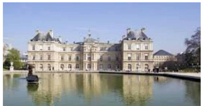
Le Palais du Luxembourg siège du Sénat à Paris dans le 6 e . https://www.parisinfo.com/musee-monument-paris/71365/Senat-Palais-du-Luxembourg

https://www.chouday.fr/election-senateurs-designation-delegues-suppliants/